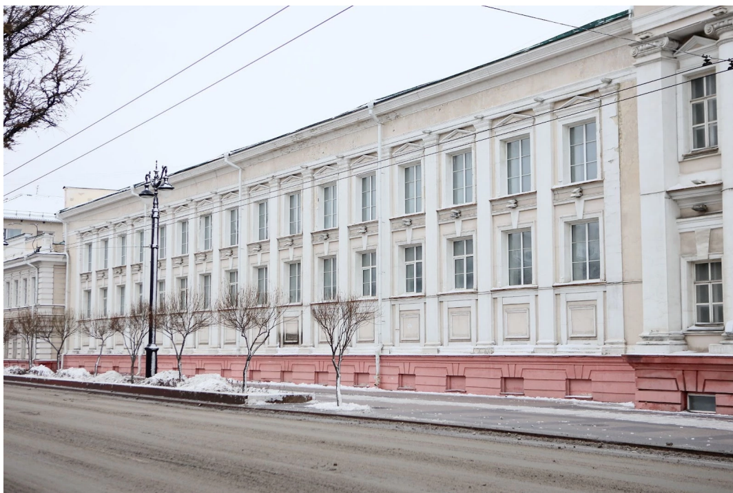
Здание спорткомплекса, примыкающее к лазарету (слева) и главному корпусу (справа).

В начале XX века на углу улицы Короленко (ранее Русиновской, названной в честь одного из атаманов Омского казачьего войска. – Прим. ред.), строится здание лазарета. Вплоть до переезда Кадетского корпуса в новое оно сохраняло своё назначение. На втором этаже находился штаб Кадетского корпуса. Краевед считает, что больных стало меньше, лазаретов хватало снизу. Построен лазарет в 1915 году, достаточно поздняя постройка, но тем не менее выдержана в общем стиле. Хотя в то время господствовала эпоха модерна и эклектики.